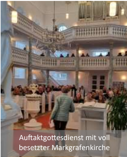
Auftaktgottesdienst mit voll besetzter Markgrafenkirche