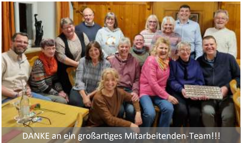
DANKE an ein großartiges Mitarbeitenden-Team!!!