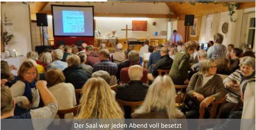
Der Saal war jeden Abend voll besetzt