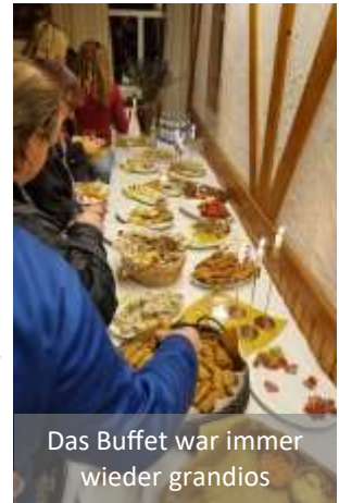
Das Buffet war immer wieder grandios