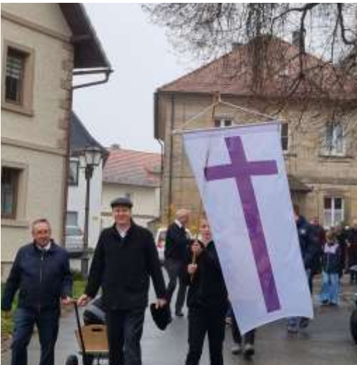
Auf dem Weg zum Kirchkaffee - Parade von der Markgrafenkirche zum Saal Gareis