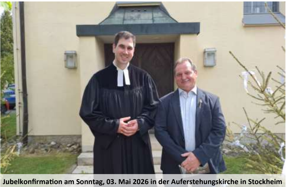
Jubelconfirmation am Sonntag, 03. Mai 2026 in der Auferstehungskirche in Stockheim